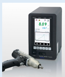
ハンドナットランナ タッチパネル搭載コントローラ