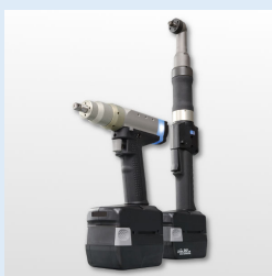
コードレス ハンドナットランナ