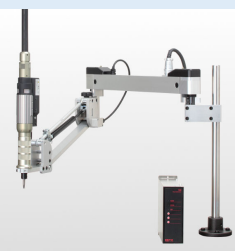
位置検出機能付き トレーサアーム