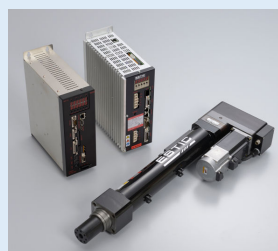
コンパクト&高精度 サーボプレス