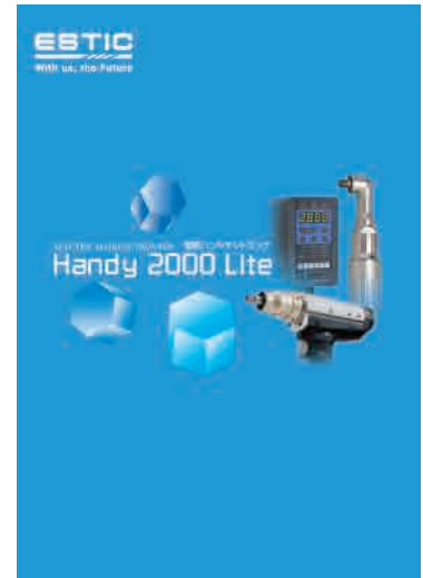
Handy 2000 Liteカタログ