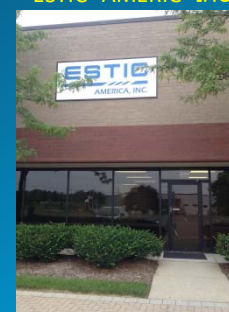
ESTIC AMERICA Inc