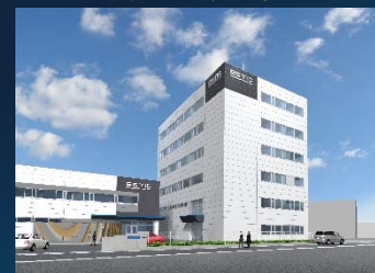
本社・東郷事業所