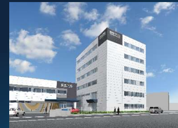
本社・東郷事業所