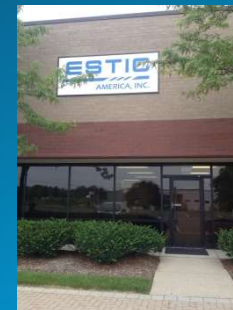
ESTIC AMERICA Inc