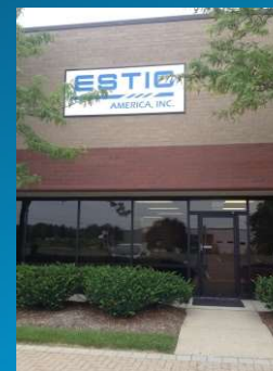
ESTIC AMERICA Inc