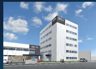
本社・東郷事業所